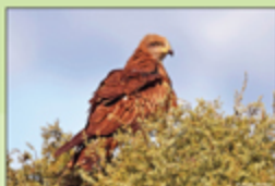
Milano Negro (Milvus migrans) © Joaquin Martínez