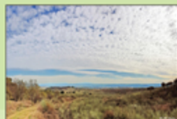
Panorámica de Coria desde el Alto del Sierro