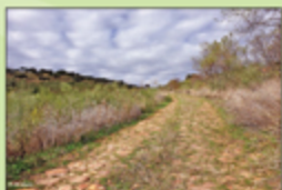
Restos arqueológicos de la Vía Dalmacia