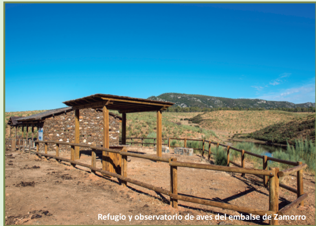
Refugio y observatorio de aves del embalse de Zamorro