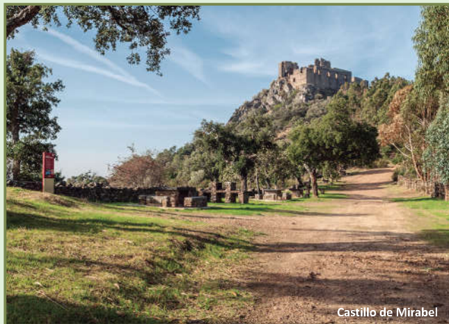
Castillo de Mirabel