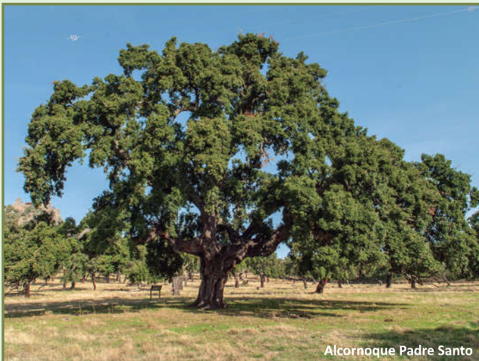
Alcornoque Padre Santo

La ruta se adentra en la dehesa boyal de Mirabel, un precioso paisaje de grandes alcornoques ( Quercus suber ) en el que destacan dos declarados árboles singulares: el conocido como Padre Santo, localizado en una derivación del trazado del sendero y por lo tanto visitable, y el alcornoque de la Dehesa o Grueso, que se encuentra en una propiedad privada. Tras cruzar el arroyo de la Rivera comienza el ascenso a la sierra de Sta. Catalina, donde la vegetación se vuelve mucho más densa apareciendo manchas de pino rodeno ( Pinus pinaster ), castaño ( Castanea sativa ) y madroño ( Arbutus unedo ), hasta coronarla para recorrer la cuerda de su cima, con unas magníficas vistas del entorno y del relieve tipo apalachense de la reserva, entre jaras ( Cistus ladanifer ), cantuesos ( Lavandula stoechas ) y brezo rojo ( Erica australis ). Ya con el embalse de la rivera del Castaño (o del Risco) a la vista, comienza el descenso por la espesura de la umbría, una bóveda vegetal en la que a todas las especies mencionadas se unen otras como rusco ( Ruscus aculeatus ), durillo ( Viburnum timus ), helechos... En todo el trayecto es fácil observar buitres leonados ( Gyps fulvus ), gavilán ( Accipiter nisus ) y un sinfín de pequeñas aves forestales, además de ciervos ( Cervus elaphus ) y otros mamíferos.