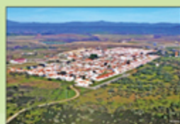
Vista panorámica aérea de Puebla de Argeme