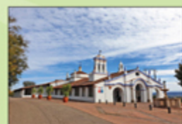
Santuario de la Virgen de Argeme (s. XVII-XVIII)

La ruta se inicia junto al modernista Puente de Hierro (1901-1909) y continúa por el antiguo camino de peregrinación al barroco Santuario de Ntra. Sra. Virgen de Argeme (s. XVII-XVIII) surcando los generosos campos de regadío que ofrece la frondosa Vega de Coria. Arribados a este punto, el peregrino podrá disfrutar de las extraordinarias vistas que ofrece el conocido como "Mirador de Argeme": asombrosa terraza natural abierta a modo de balcón sobre el caudaloso río Alagón desde donde poder contemplar la riqueza paisajística que ofrece este bello enclave medioambiental. Desde aquí, el senderista decidirá si completar el recorrido continuando la ruta en dirección sur tomando una pista que baja hasta las vegas del río Alagón entre jaras, retamas, carrasqueras y encinas, para posteriormente unirse a un camino llano que transita entre campos de explotaciones agropecuarias de agricultura de regadío y de ganadería extensiva sobre las que se deslizan los arroyos del Salto y del Gallinero. Finalmente, la ruta continúa por una prolongada ascensión que serpentea entre el adensado paisaje que envuelve al blanco poblado de colonización de Puebla de Argeme.