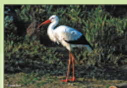
Cigüeña Blanca ( Ciconia ciconia )