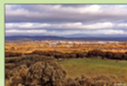
Panorámica de Coria desde el Alto de Mínguez