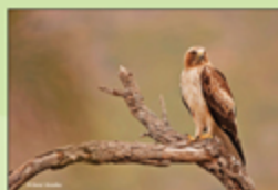
Águila Calzada ( Hieraetus pennatus ) © Daniel González