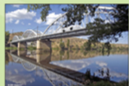
Vista general del Puente de Hierro

La ruta se inicia junto Puente de Hierro (1901-1909) sobre el río Alagón, desde el que, una vez cruzado, el viajero transita en dirección sur por una estrecha vereda paralela al curso fluvial que desemboca en una pista asfaltada denominada "Camino del Erial", circundada de fincas de regadío y praderas, que conecta con un camino de tierra que, entre cultivos, alcanza la portera de entrada a la Finca Municipal de Mínguez: ejemplo de adecuación sostenible del bosque y matorral mediterráneo a los usos agropecuarios en régimen extensivo de la dehesa extremeña. Desde este punto, el trazado del camino se torna sinuoso y en continuada pendiente ascendente entre encinas y agudos peñascales de cenicientas pizarras y el olor de las montaraces hierbas: romero, tomillo o cantueso que, por doquier, fluyen sobre los cerros de la Dehesa de Mínguez, donde el merino paca y el vacuno, tumbado sobre el pasto, rumia en los largos meses del estío. Enclave final que nos brinda la oportunidad de poder contemplar, desde el mirador natural del "Alto de Mínguez", el panorámico paisaje del Valle del Alagón con las Sierras de Gata y de Gredos de fondo.