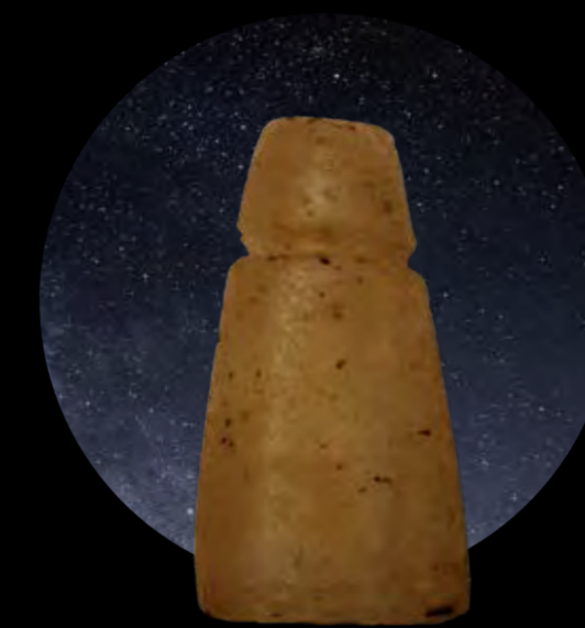
Betilo encontrado en la Cueva de los Caballos de Fuentes de León

En Fuentes de León quizá puedas recibir el regalo de algún dios prehistórico en forma de meteorito o, en su defecto, en forma de meteoro o estrella fugaz. Sea como fuere y si has logrado obtener uno de esos “regalos divinos” no olvides hacer tu ofrenda. Elige tu BETILO y colócalo a la entrada de una cueva de la misma forma que hicieron nuestros antepasados hace miles de años.