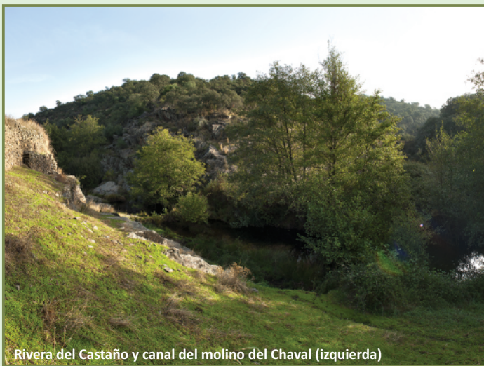
Rivera del Castaño y canal del molino del Chaval (izquierda)

Una vez cruzada la vía férrea de la línea Madrid-Cáceres, el sendero recorre primero un paisaje suave y adhesado de encinas ( Quercus ilex subsp. Ballota ) que a medida que se acerca a la ermita y a la rivera se vuelve más sinuoso y agreste, apareciendo algunos alcornoques ( Quercus suber ) y monte bajo compuesto principalmente de jara ( Cistus ladanifer ). Ya en el entorno de la ermita de Tebas, precedida por una amplia área recreativa, encontramos cultivos de olivo ( Olea europaea ), mientras que el final del trazado de ida, un bello paisaje rivereño de alisos ( Alnus glutinosa ), sauces ( Salix sp. ) y otras especies propias de este hábitat, enmarcan al molino del Chaval en la rivera del Castaño. El molino conserva además buena parte de su estructura, conformando un interesante conjunto con el canal y el cubo de presión; hay que tener en cuenta, eso sí, que se trata de una propiedad privada. En cuanto a la fauna, a lo largo del recorrido es fácil avistar numerosas especies de aves forestales como rabilargos ( Cyanopica cyanus ), pinzones comunes ( Fringilla coelebs ), currucas ( Sylvia sp. )... y rapaces como busardos ratoneros ( Buteo buteo ), milano real ( Milvus milvus ) o águila calzada ( Aquila pennata ).